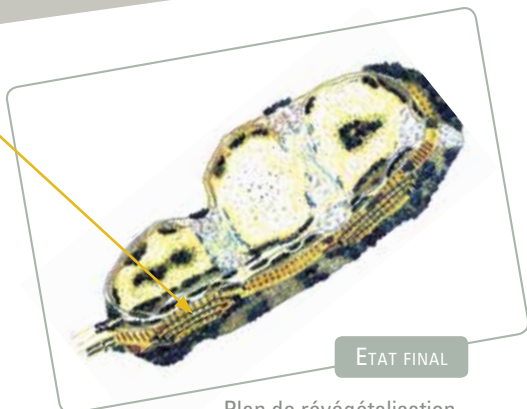
Plan de révégétalisation

PARCELLES CULTIVÉES Cyprés, chênes truffiers, oliviers, arbres fruitiers (cerisiers, pêchers...)